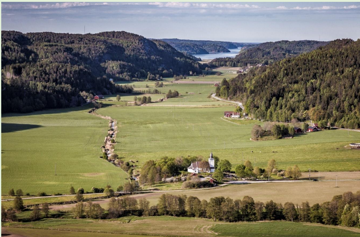
Bilder Per Pixel