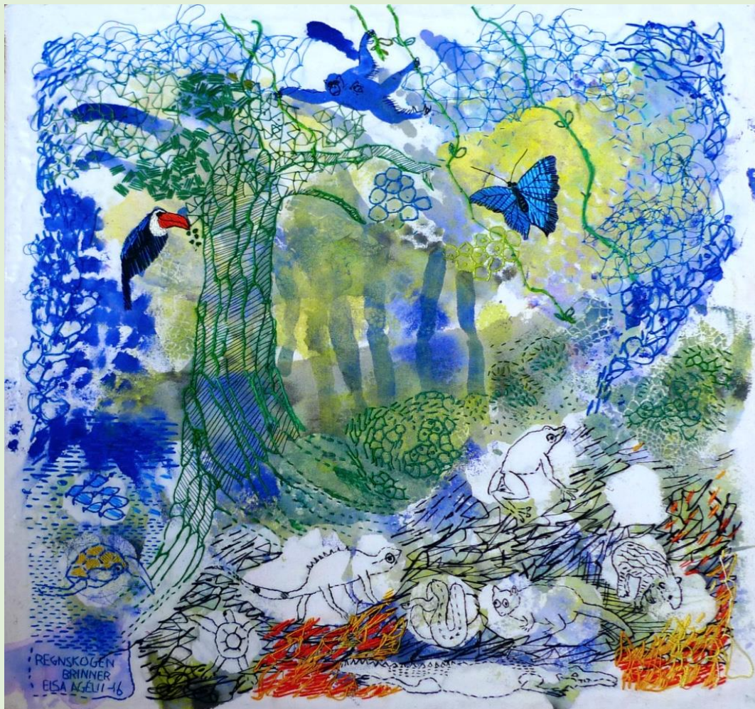
Broderi av Elsa Agéll